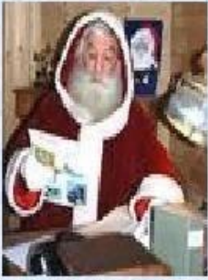
Пер Ноэль - Франция