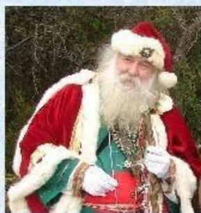
Фазер Кристмас - Британия