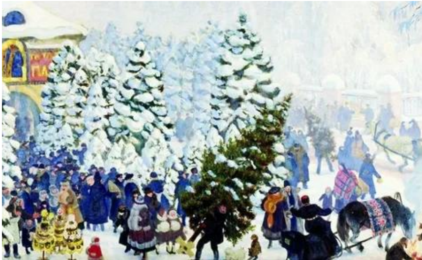
Б. Куатодиев. Ёлочный торг, 1918 г.

Так появилась традиция украшать дома и дворы еловыми и сосновыми ветками. Этот обычай царь тоже перенял у иностранцев, которые жили в Немецкой слободе. Для немцев ель была символом вечной жизни, а у славян испокон веков хвойные ветки соотносились с погребальными обрядами, поэтому многим было сложно принять новые обычаи.