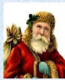
Святой Николай – соратник Деда Мороза из Бельгии