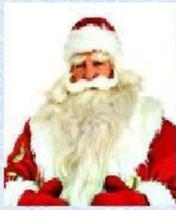
Дед Мороз - Россия